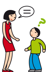
A du mal à comprendre et à se faire comprendre