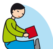
Manque de jeux imaginatifs