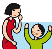
Rit de façon inappropriée