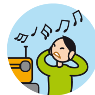
Peut être hypersensible aux sons, aux odeurs ...