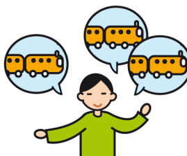
Parle de façon incessante sur un sujet particulier