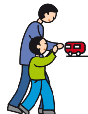
Indique ses besoins en utilisant la main d'un adulte