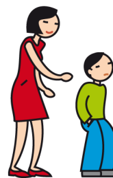
Manifeste de l'indifférence