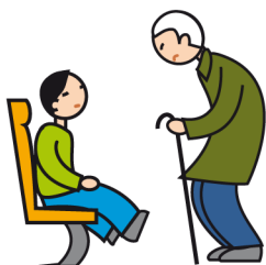
Comprend mal les conventions et les règles sociales