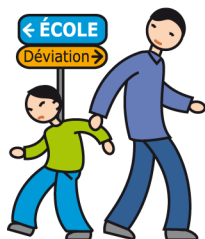
N'apprécie pas les changements