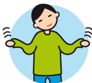
Présente des comportements bizarres