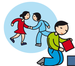
Ne joue pas avec les autres enfants