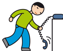
Utilise les objets de façon atypique