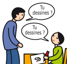
Utilise le langage de façon écholalique